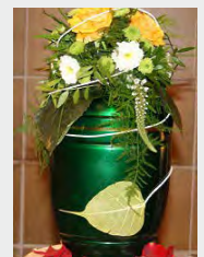
Metall, z.B. grün zzgl. 69,90 €

Dies ist ein Online - Angebot und behält seine Gültigkeit für 3 Monate. Auf Anfrage erhalten Sie ein zugeschnittenes Angebot per E-Mail. Gern stehen wir Ihnen für ein telefonisches Beratungsgespräch zur Verfügung. Beachten Sie bitte hierbei unbedingt unsere Bürozeiten.