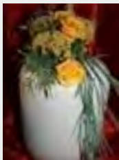
Urne Bio hell inkl.