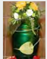
Metall, z.B. grün zzgl. 69,90 €

Dies ist ein Online - Angebot und behält seine Gültigkeit für 3 Monate. Auf Anfrage erhalten Sie ein zugeschnittenes Angebot per E-Mail. Gern stehen wir Ihnen für ein telefonisches Beratungsgespräch zur Verfügung. Beachten Sie bitte hierbei unbedingt unsere Bürozeiten.