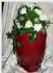
Urne Bio, z.B. rot zzgl. 59,90 €