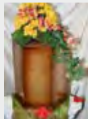
Holz - Natur, gebeizt zzgl. 69,90 €