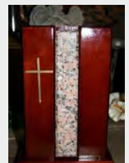
z.B. Urne Holz / Marmor zzgl. 99,90 €

Dies ist ein Online - Angebot und behält seine Gültigkeit für 3 Monate. Auf Anfrage erhalten Sie ein zugeschnittenes Angebot per E-Mail. Gern stehen wir Ihnen für ein telefonisches Beratungsgespräch zur Verfügung. Beachten Sie bitte hierbei unbedingt unsere Bürozeiten.