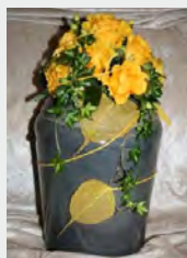
Holz grau zzgl. 59,90 €