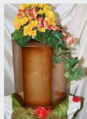
Holz - Natur, gebeizt zzgl. 69,90 €