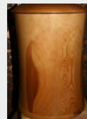
z.B. Urne Holz natur zzgl. 99,90 €