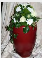
Urne Bio, z.B. rot zzgl. 59,90 €