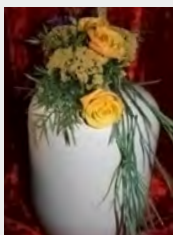
Urne Bio hell inkl.