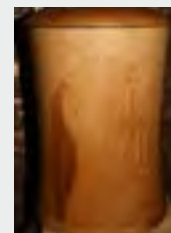
z.B. Urne Holz natur zzgl. 99,90 €