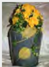
Holz grau zzgl. 59,90 €