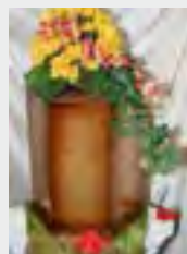
Holz - Natur, gebeizt zzgl. 69,90 €