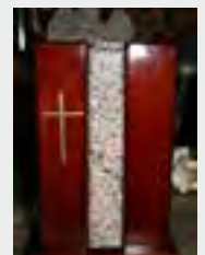
z.B. Urne Holz / Marmor zzgl. 99,90 €

Dies ist ein Online - Angebot und behält seine Gültigkeit für 3 Monate. Auf Anfrage erhalten Sie ein zugeschnittenes Angebot per E-Mail. Gern stehen wir Ihnen für ein telefonisches Beratungsgespräch zur Verfügung. Beachten Sie bitte hierbei unbedingt unsere Bürozeiten.