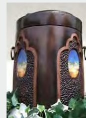
Seeurne „Salz“ zzgl. 149,90 €