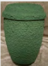
Seeurne, grün inkl.