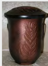
Seeurne „Gips“ zzgl. 149,90 €