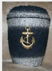
Seeurne „Anker“ zzgl. 89,90 €