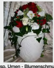
Bsp. Urnen - Blumenschmuck Seeurne „Nr. 13 Gips“ zzgl. 139,90 €

Dies ist ein Online - Angebot und behält seine Gültigkeit für 3 Monate. Auf Anfrage erhalten Sie ein zugeschnittenes Angebot per E-Mail. Gern stehen wir Ihnen für ein telefonisches Beratungsgespräch zur Verfügung. Beachten Sie bitte hierbei unbedingt unsere Bürozeiten.