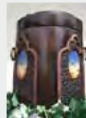
Seeurne „Salz“ zzgl. 149,90 €