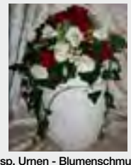
Bsp. Urnen - Blumenschmuck Seeurne „Nr. 13 Gips“ zzgl. 139,90 €

Dies ist ein Online - Angebot und behält seine Gültigkeit für 3 Monate. Auf Anfrage erhalten Sie ein zugeschnittenes Angebot per E-Mail. Gern stehen wir Ihnen für ein telefonisches Beratungsgespräch zur Verfügung. Beachten Sie bitte hierbei unbedingt unsere Bürozeiten.