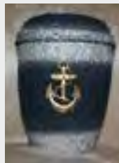
Seeurne „Anker“ zzgl. 89,90 €