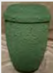
Seeurne, grün inkl.