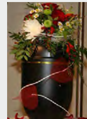
Metall, z.B. schwarz zzgl. 69,90 €