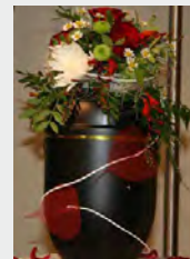
Metall, z.B. schwarz zzgl. 69,90 €