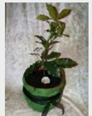
Baum der Engel zzgl. 489,00 €

Dies ist ein Online - Angebot und behält seine Gültigkeit für 3 Monate. Auf Anfrage erhalten Sie ein zugeschnittenes Angebot per E-Mail. Gern stehen wir Ihnen für ein telefonisches Beratungsgespräch zur Verfügung. Beachten Sie bitte hierbei unbedingt unsere Bürozeiten.