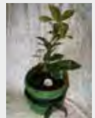
Baum der Engel zzgl. 489,00 €

Dies ist ein Online - Angebot und behält seine Gültigkeit für 3 Monate. Auf Anfrage erhalten Sie ein zugeschnittenes Angebot per E-Mail. Gern stehen wir Ihnen für ein telefonisches Beratungsgespräch zur Verfügung. Beachten Sie bitte hierbei unbedingt unsere Bürozeiten.